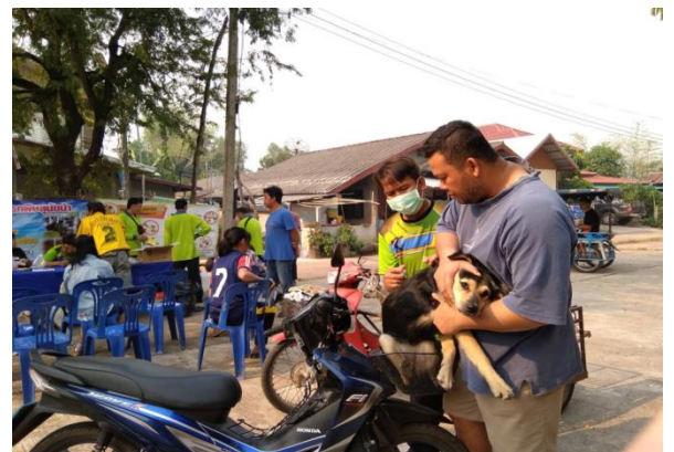
โครงการควบคุมป้องกันโรคพิษสุนัขบ้า