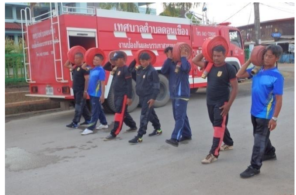
กิจกรรมซ้อมแผนเพื่อเตรียมการและเฝ้าระวังป้องกันอัคคีภัย ประจำปี ๒๕๖๒