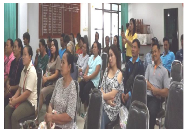
โครงการอาหารปลอดภัย