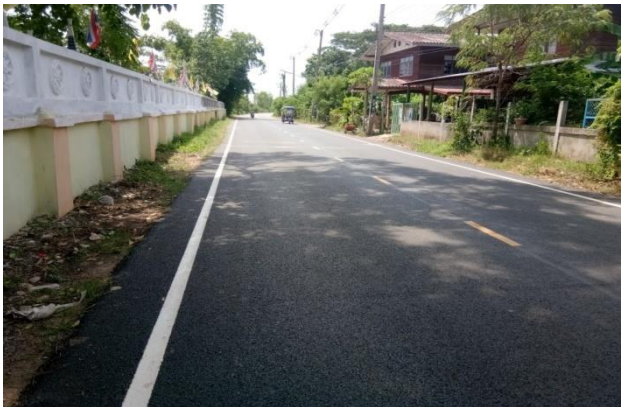
โครงการเสริมผิวจราจรแอสฟัลติกส์คอนกรีตถนนดอนเชียง-สร้างแป้น