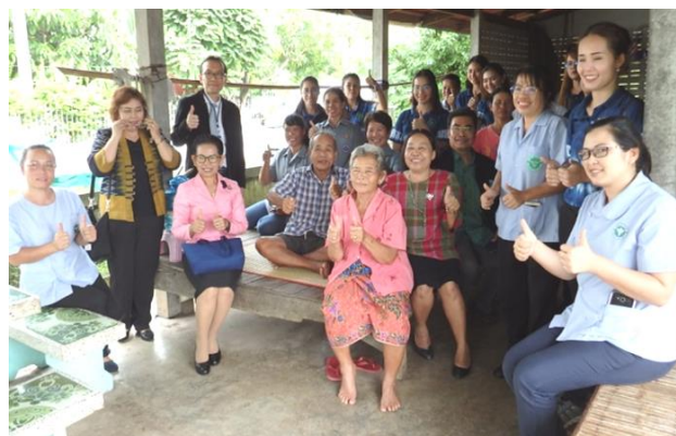
***โครงการเยี่ยมบ้านผู้สูงอายุ ผู้พิการ และผู้ป่วยเอดส์ ประจำปี ๒๕๖๒***