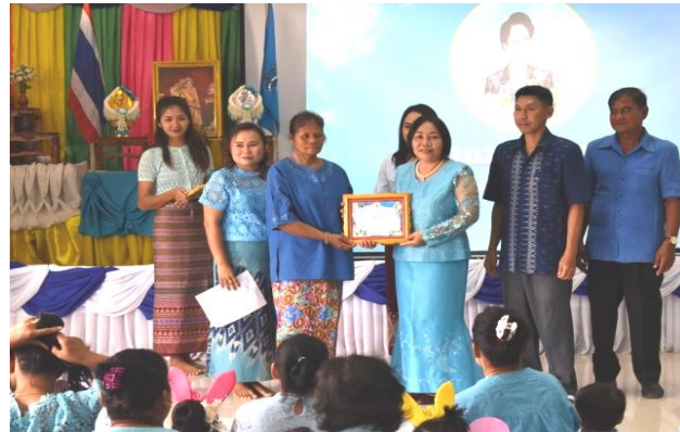
โครงการจัดกิจกรรม“วันแม่แห่งชาติ” ประจำปี ๒๕๖๒