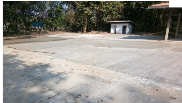
โครงการเทศบาล คสล .ป่าช้าดอนขาว บ้านสร้างแป้น