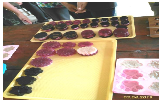
โครงการพัฒนากลุ่มสตรี หลักสูตร”การทำสบู่สมุนไพร”