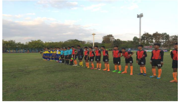
โครงการแข่งขันกีฬาระหว่างองค์กรปกครองส่วนท้องถิ่น