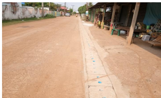
โครงการก่อสร้างวางระบายน้ำ คสล.ถนนประปา บ้านดอนเชียง