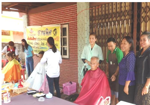
โครงการเทศบาลเคลื่อนที่พบประชาชน ประจำปี ๒๕๖๒