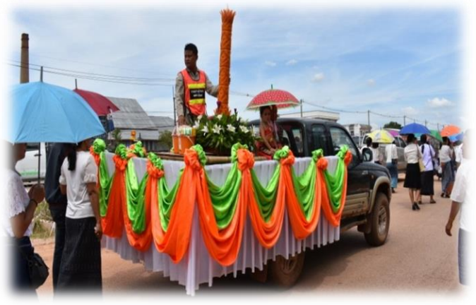
โครงการแห่เทียนเข้าพรรษา ประจำปี ๒๕๖๒