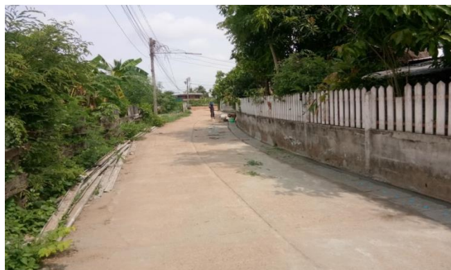
โครงการก่อสร้างวางระบายน้ำ คสล.ซอยแสงจันทร์ถึงซอยราชพัฒนา บ้านดอนเชียง