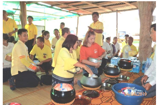
จัดกิจกรรมเนื่องในวันเทศบาล ๒๔ เมษายน ๒๕๖๒