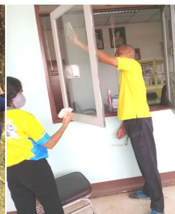
กลุ่มจิตอาสา กลุ่มพลังมวลชน ประชาชน จัดทำกิจกรรม ” BIG CLEANING DAY”