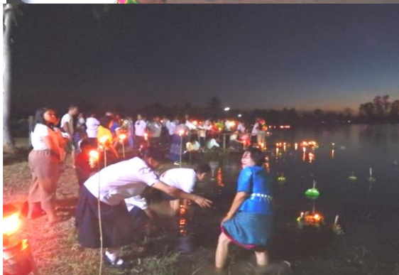
โครงการจัดงานประเพณีลอยกระทง