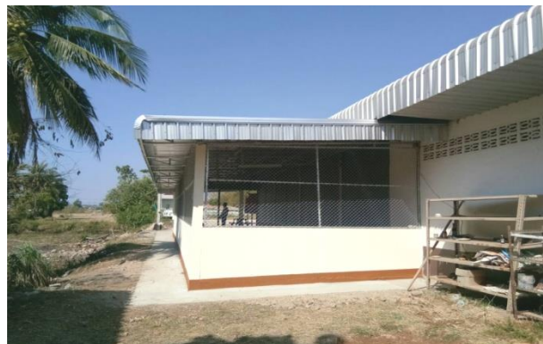
โครงการต่อเติมอาคารประชาร่วมใจ ชุมชน ๖ บ้านดอนเชียง