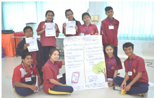
โครงการรู้เท่าทันสื่อออนไลน์ ประจำปี ๒๕๖๒