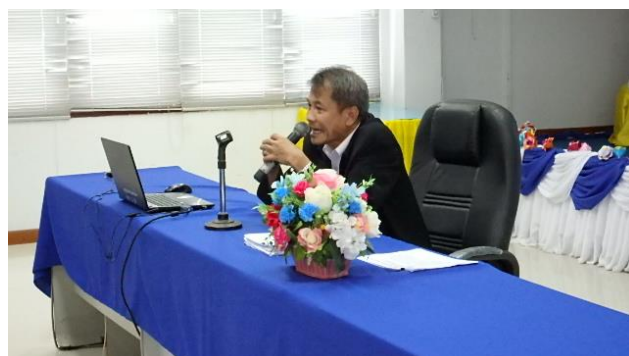
โครงการอบรมให้ความรู้ด้านระเบียบกฎหมายท้องถิ่น สำหรับผู้บริหาร สมาชิกสภา พนักงานท้องถิ่น ประจำปีงบประมาณ ๒๕๖๒