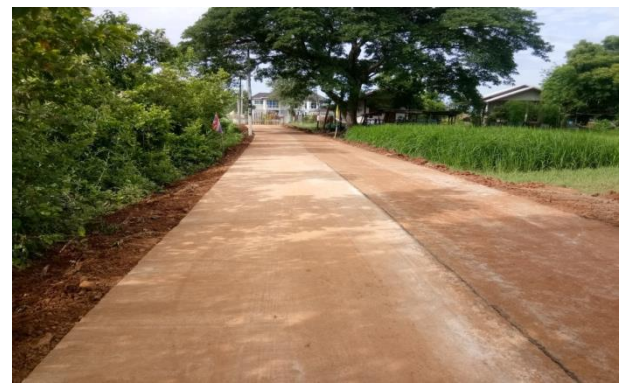
โครงการก่อสร้างถนน คสล.ทางเข้าสำนักสงฆ์พุทธธรรมบ้านดอนเชียง