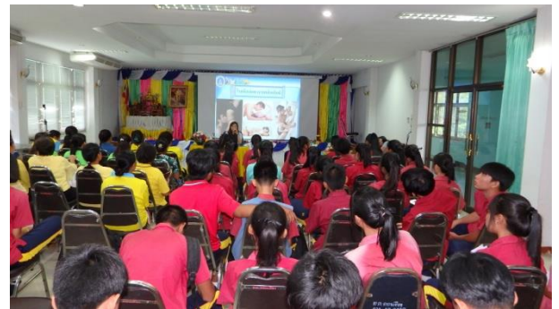
โครงการควบคุมและป้องกันโรคเอดส์ ประจำปี ๒๕๖๒