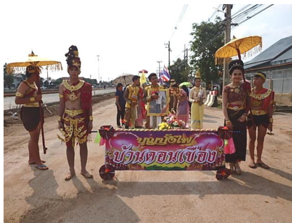
โครงการจัดงานประเพณีบุญบั้งไฟ ประจำปี ๒๕๖๒