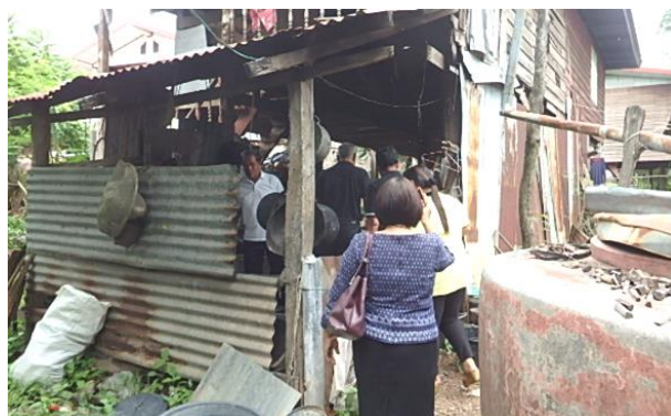
ประชุมคณะกรรมการเพื่อพิจารณาให้ความช่วยเหลือผู้ประสบภัย ประจำปี ๒๕๖๒