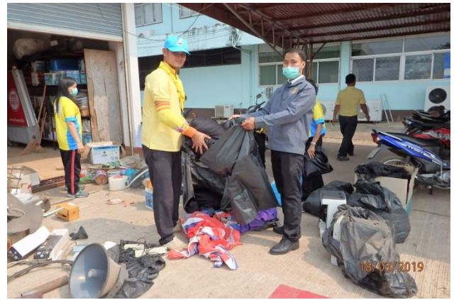
กลุ่มจิตอาสา กลุ่มพลังมวลชน ประชาชน จัดทำกิจกรรม ” BIG CLEANING DAY”