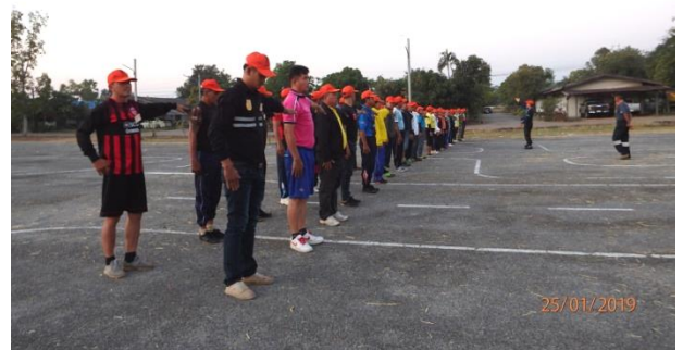
โครงการฝึกอบรมอาสาสมัครป้องกันภัยฝ่ายพลเรือน (อปพร.) หลักสูตรจัดตั้ง