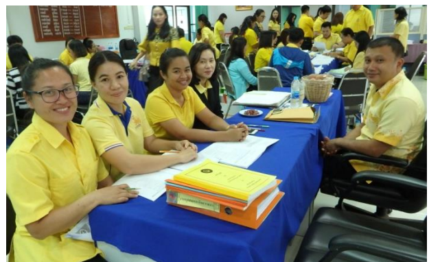
รับการตรวจประเมินผลการปฏิบัติงานของ อปท.(LPA) จังหวัดสกลนคร