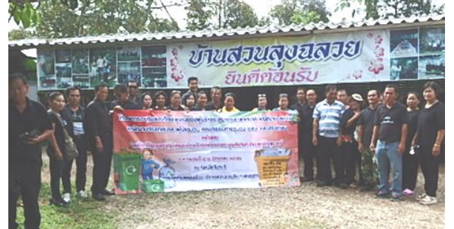
โครงการอบรมและศึกษาดูงานของผู้บริหาร สมาชิกสภาเทศบาล พนักงาน ลูกจ้าง พนักงานจ้างเทศบาล ผู้นำชุมชน คณะกรรมการชุมชน อสม. และประชาชน ประจำปี ๒๕๖๒