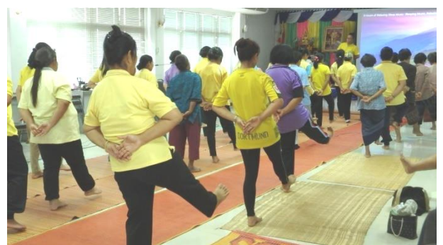
โครงการส่งเสริมสนับสนุนการดูแลสุขภาพด้วยการแพทย์แผนไทย