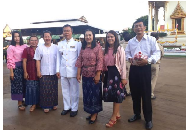
กิจกรรมการจัดงานวันปิยมหาราช ๒๓ ตุลาคม ๒๕๖๑ ณ ลานหน้าพระบรมราชานุสาวรีย์รัชกาลที่ ๕ ที่ว่าการอำเภอสว่างแดนดิน