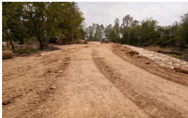
โครงการหินลูกรังผิวจราจรถนนเลียบลำน้ำยาม