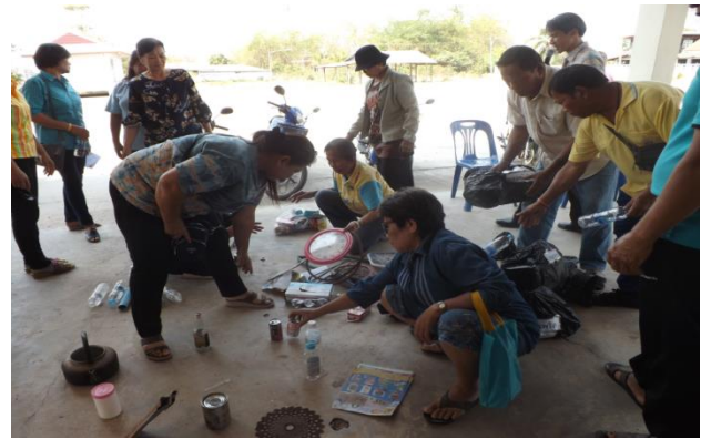
โครงการการจัดการขยะ