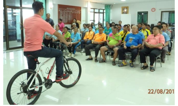
โครงการส่งเสริมสุขภาพด้วยการปั่นจักรยาน