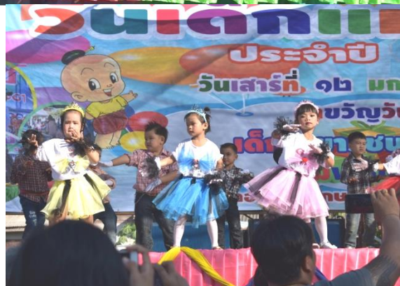
โครงการจัดกิจกรรมวันเด็กแห่งชาติ