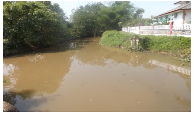
โครงการส่งเสริมท้องถิ่นสู่สังคมสีเขียว (LA๒๑)