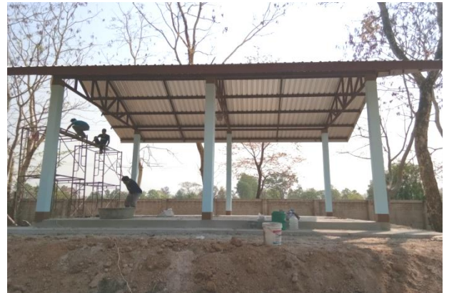
โครงการก่อสร้างอาคารอเนกประสงค์ บริเวณบ่อขยะเทศบาลฯ