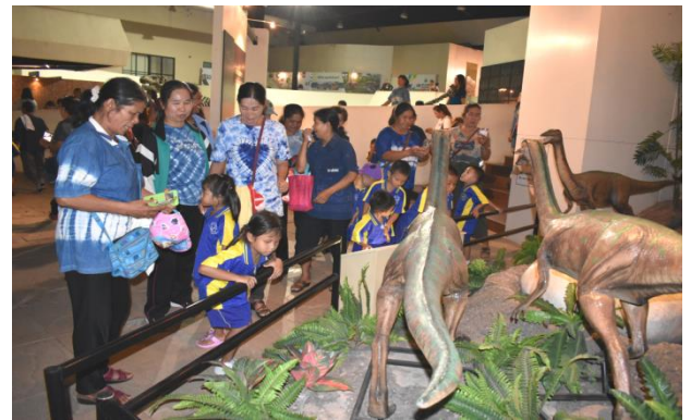
โครงการคาราวานเสริมสร้างเด็ก