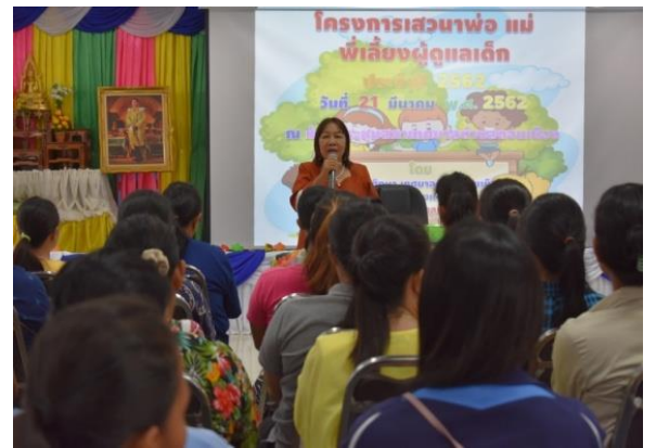
โครงการเสวนาพ่อแม่ พี่เลี้ยงผู้ดูแลเด็ก