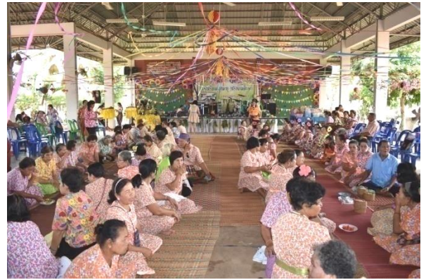
จัดกิจกรรมเนื่องในวันผู้สูงอายุ และวันครอบครัว ประจำปี ๒๕๖๒