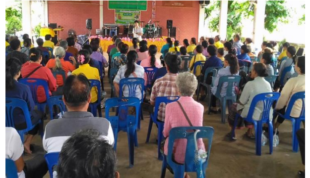
โครงการสร้างเสริมสุขภาพผู้สูงอายุอย่างยั่งยืน