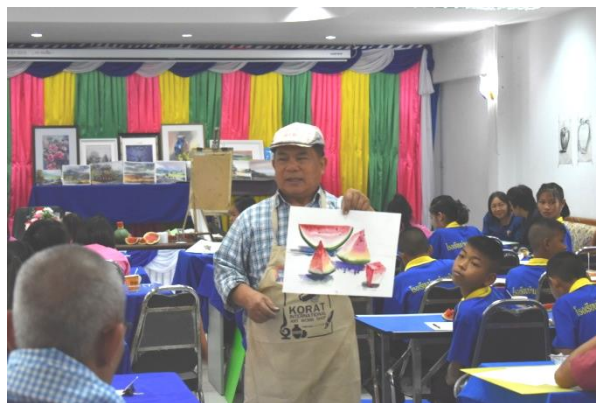
โครงการต้นกล้าวิศิลป์ ประจำปี ๒๕๖๒