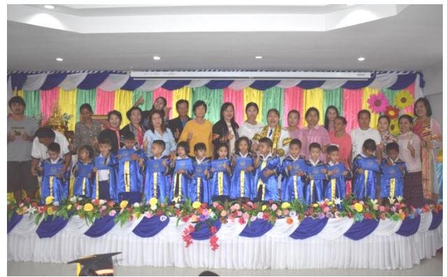
โครงการบัณฑิตน้อย ประจำปีงบประมาณ ๒๕๖๒