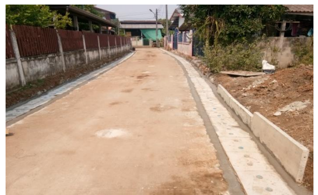
โครงการก่อสร้างรางระบายน้ำ คสล.แยกซอยอิสรธิปไตย บ้านดอนเชียง