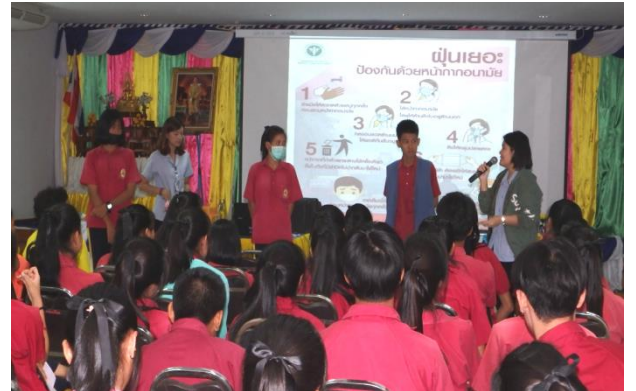
โครงการควบคุมป้องกันโรคติดต่อ