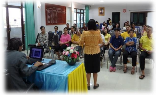
โครงการ "ตลาดสดน่าซื้อ"ประจำปี ๒๕๖๒