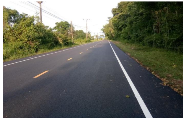
โครงการเสริมผิวจราจรแอสฟัลติกส์คอนกรีตถนนดอนเชียง-สร้างตุ้