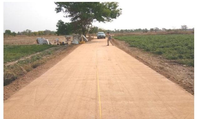
โครงการก่อสร้างถนน คสล.ซอยดอนเชียงร่วมใจถึงลำน้ำยาม