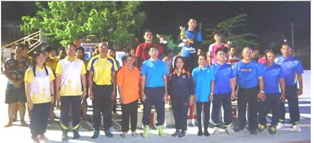
โครงการกีฬาชุมชนสัมพันธ์ ประจำปี ๒๕๖๒