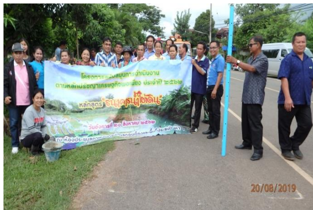
โครงการสนับสนุนการดำเนินงานตามหลักปรัชญาเศรษฐกิจพอเพียง หลักสูตร “ธนาคารน้ำใต้ดิน”