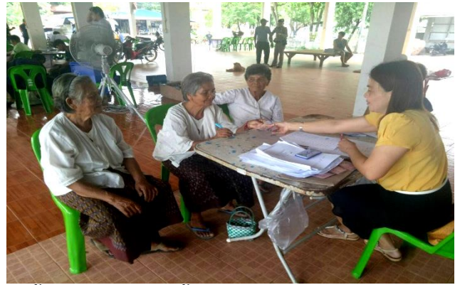
บริการเชิงรุก ออกจ่ายเบี้ยยังชีพผู้สูงอายุ /เบี้ยยังชีพผู้พิการ/เบี้ยยังชีพผู้ป่วยเอดส์