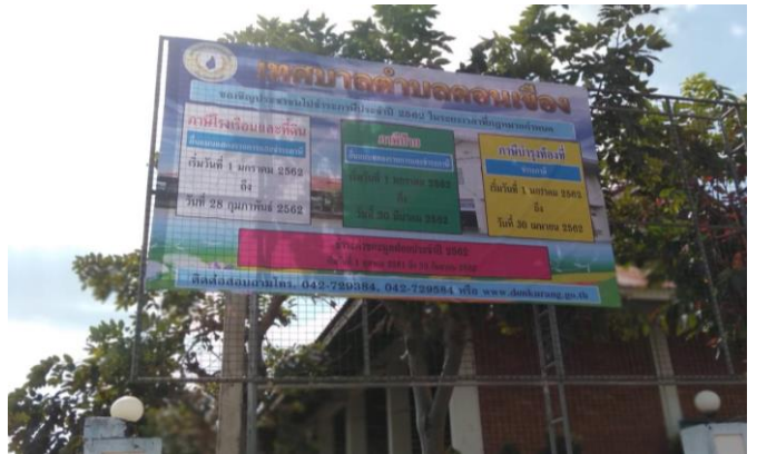
โครงการประชาสัมพันธ์ข้อมูลภาษี