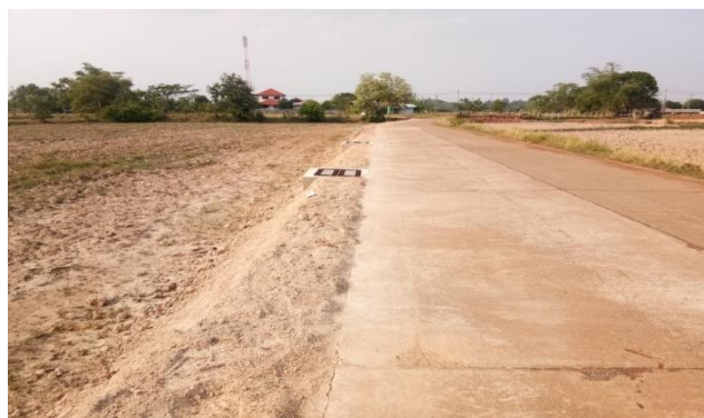
โครงการวางท่อระบายน้ำพร้อมบ่อพัก คสล. ถนนประชาอุทิศเชื่อมถนน ทล .๒๒