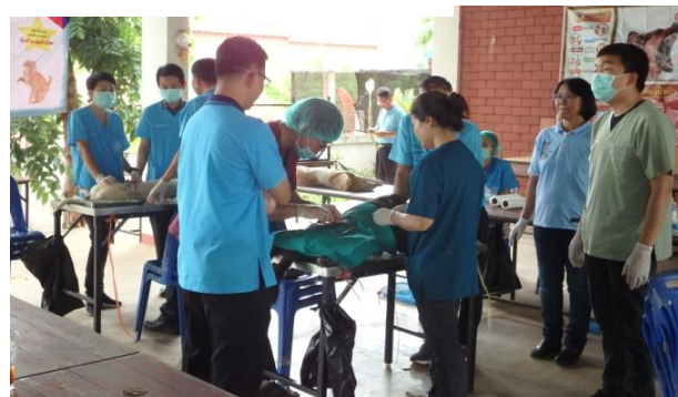
*** ออกบริการผ่าตัดทำหมันให้กับสุนัขและแมวฟรี ****