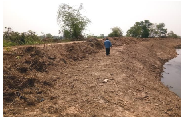
โครงการขุดลอกห้วยยามเทศบาลตำบลดอนเชียง